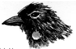
Ook vogels kunnen een teek hebben.

Lees dit boekje en je weet van alles over deze kleine vampiers.