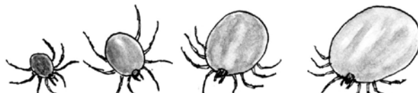
Een vrouwtje: van dun naar dik.

Schapenteken zijn bijna het hele jaar actief. Ze houden van vochtig weer en vochtige grond. Anders drogen ze uit. De winter is hun rustperiode... als het koud is tenminste. Ze overwinteren dan.