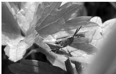
Veldsprinkhaan zwaait met linkerpootje: daaaaag!