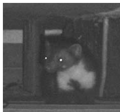
Steenmarter op zolder geflitst.