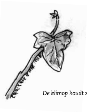
De klimop houdt zich vast met korte hechtwortels.

Iedereen kent de klimop. Je ziet hem in bossen, tuinen en parken. Misschien denk je: wat een saaie plant, niks aan! Vergis je niet, klimop is bijzonder. Hij groeit en bloeit anders dan andere planten.