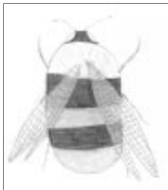
clim donders (groep 5)