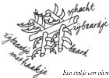
Een stukje veer uitvergroet.

Ga met je vingers een paar keer over een veer (dekveer of pen): van boven naar beneden. De veer wordt dan heel rafelig. De baarden zitten niet meer aan elkaar vast. Bekijk de baarden eens met een loep.