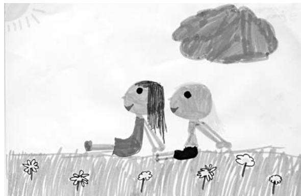
Simone, 9 jr.

de lente // het gras, de bloemen / het hoort er allemaal bij / de bijtjes die zoemen / de lammetjes die mekkeren / de zon die schijnt / wat is het leuk als het lente is // Isa, 7 jr.