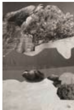
rienne vervuurt (9 jaar)