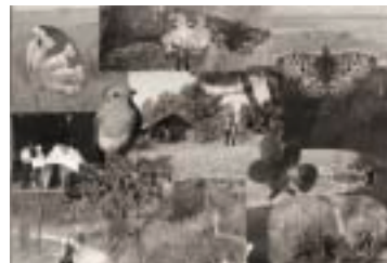
evy schmitz (8 jaar)